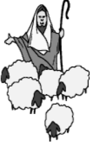
راعي من الشرق