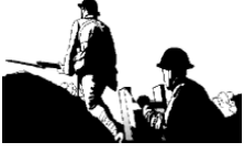
العداوة نحو الله

إن تعاليم العهد الجديد واضح- فالخطية تغضب الله القدوس لذا يصبح الإنسان عدواً لله الآن. ولكن مات يسوع بدلاً من الخطاة حتى يصالحهم مع الله. 5 فلم يعودوا بعد أعداءً لله ولكن حمل يسوع في جسده عقاب خطيتهم.