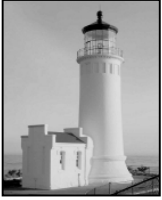
يسوع كان المنارة الرائعة ونور العالم

الله لم يجعل الناس قط يكرهون يسوع، ولكنه استخدم الكراهية التي كانت موجودة في الإنسان ليحقق أهدافه. فحياة يسوع الكاملة أظهرت عيوب ونقائص الآخرين بصورة جلية. لذلك كانوا يكرهون يسوع ويفضلون أن يقتلوه بدلاً من أن يكشف نوره طرقهم الشريرة ويعريها، فيسوع كان هو النور في عالم مظلم. وحاول الناس أن يطفئوا هذا النور وفضلوا الظلمة بسبب خطاياهم. اقرأ يوحنا 3:19