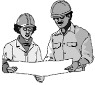
العمل بحسب خطة

أبلغنا كاتبو العهد الجديد بأن موت يسوع لم يكن على سبيل الخطأ الفادح ولكنه كان جزءاً من خطة الله وهدفه. ولقد استخدم الله شر الإنسان ليقدم طريقة للغفران لأولئك الذين يتوبون عن الخطية. وللهشمة، فحتى الذين صلبوا يسوع سوف يكتشفوا أن الغفران كان متاحاً لهم أيضاً! فإن جريمتهم الشنعاء قدمت السبيل الذي يمكن به الغفران حتى لخطيتهم! وفي أواخر هذه الدراسة سوف نرى كيف أن موت يسوع يجعل الغفران ممكناً.