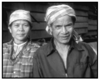
السماء يدخلها المؤمنون من كل الأجناس