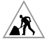
Ishara zilikuwa na maana

K ila sehemu iliyotuzunguka ina ishara- na yote ina maana kwa namna Fulani. Ishara ya kulia inawaambia madereva wachukue tahadhari, maana watu wanafanya kazi barabarani. Miujiiza alioifanya Yesu ilikuwa ishara, nazo pia zina maana. Injili ya Mathayo, Marko, Luka, na Yohana zimeorodhesha miujiza mingi na ishara nyingi alizozifanya Yesu. Miujiiza mingi alioifanya Yesu ilikuwa yenye huruma/kujali. Aliwaponya wale waliokuwa na magonjwa, na alimhurumia kiwete akamfanya atembea na kipofu apate kuona. 5 Aliwafufua hata wafu.