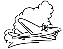
Rudi katika nyakati za nyuma

F ikiria wewe mwenyewe umeingia kwenye ndege/usafiri wa anga ukisafiri, sio kwenda nchi nyingine, bali kurudi nyuma mpaka nyakati zilizopita! Ghafla ukatua katika nchi ya Israeli kama ilivyokuwa miaka 2,000 iliyopita. Unapotoka nje ya ndege unagundua kuwa kila mmoja anaongea/anaongelea mwanamume/mtu mmoja aitwaye Yesu, kutoka mji uitwao Nazareti. Baadhi ya watu wanampenda, bali wengine wanamchukia. Baadhi wakinung'unika na kusema kuwa yeye ni mleta fujo au mvurugaji na mdanganyifu, 1 na wengine wanamsema kuwa ni mtu mwema tena maalum kutoka kwe Mungu, nabii. Na wapo baadhi wanoamini kuwa Yeye ni mwana wa Mungu, Kristo.