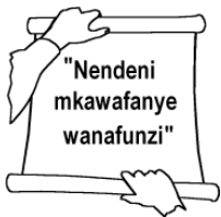
Walitii amri Yake

Punde tu dhambi inapotubiwa na kuachwa, kuna hali moja tu inayobaki kwa ajili ya wokovu. Ni imani katika Kristo (inayofuata).