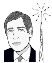
Kusikiliza na kutenda

Yesu akasema, “Unafikiri nini juu ya Kristo?” 1 Katika masomo haya tumekuwa tukitafiti juu ya Kristo. Unafikiri nini juu Yake, na utajibu kwa namna gani? Yesu anawataka watu wajibu kwa kutenda mambo na vitu Alivyovisema. Aliwaambia watumie masikio yao na wasiwe wenye kupuuzia, kana kwamba ni viziwi.