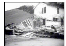
Historia ya nyumba mbili

Y esu ana wasilizaji wanaotamani – lakini sio wote walioandaliwa kutubu na kukubaliana na mafundisho yake. Walikuwa tayari kukiri na kumwita Bwaba – lakini walishindwa kutenda aliyoyasema. Walimheshimu kwa midomo yao, lakini maisha yao hayakubadilika.