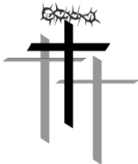
祂会在十字架 架上受苦!