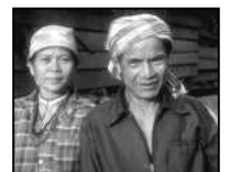
天堂包括各种族的人

来 自世界各地的信徒将来会一同聚首天堂。新约《圣经》描绘天堂是神和天使居住的圣所，在那里没有任何罪恶和污秽 7 。信徒因基督的受死得与神和好，罪污已被涂抹，再没有任何东西能够拦阻信徒死后进入天堂。