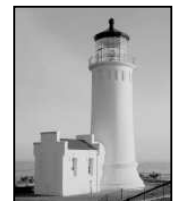
耶稣是一道伟大的光

神没有令人憎恨耶稣，祂只是巧妙地用了人的仇恨成就祂的计划。耶稣完全的生命更突显了其他人的不完美。因此，他们憎恨耶稣，宁可把耶稣除掉，也不愿自己的罪污在祂的光辉中显露无遗。耶稣是黑暗中的亮光，人们却想把这光熄灭，他们宁愿活在黑暗罪恶里。请翻开约翰福音 3:19。