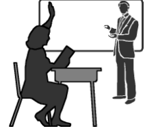
एक चांगला शिक्षक

येशुचे तीन दाखले आपल्यासारख्या पापी लोकांची तुलना करतात ज्या हरविल्या होत्या व त्या पुनः आनंदाने सापडल्या . २ या तीन्ही दाखल्यांचा अर्थ अगदी सरळ आहे . स्वर्गामध्ये आनंद व उल्हास होतो जेव्हा हरवलेले पापी लोक देवाकडे “घरी” परततात .