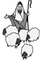
एक पूर्वेकडील मेंढपाळ

शेवटी येशु म्हणाला त्याचं मरण “अनेकांच्या खंडणीसाठी” होतं . ७ मरण्यापूर्वी कांही तास अगोदर त्याने आपल्या शिष्यांना भाकर व द्राक्षारस यांचा एक प्रतिकामक धडा शिकवला . तो म्हणाला की द्राक्षारस व भाकर हे त्याच्या शरिराचे व रक्ताचे प्रतीक आहेत . शिष्यांना येशूच्या मरणांतील प्रीतीची आठवण म्हणून कायमस्वरूपी घेण्याची आज्ञा दिली . ८