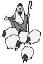
Un pastor del Este

Finalmente, Jesús dijo que Su muerte era un ‘rescate para muchos’. 7 Y pocas horas antes de morir, enseñó a sus discípulos una lección simbólica con pan y vino como emblemas de Su cuerpo y sangre. Ello debería ser un recordatorio perpetuo de Su amor por ellos. 8