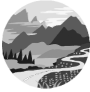
Las leyes de la alegría

Ahora mira otros aspectos de Su Enseñanza.