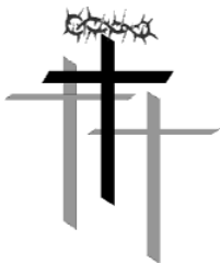
¡Sufriría sobre la cruz!

Jesús, por otra parte, dijo que Su muerte era la causa primaria de Su nacimiento. Previó una muerte cruel por crucifixión- una de las muertes más dolorosas y humillantes que una persona pueda experimentar. Fue una predicción impresionante. ¿Por qué una persona querría matar a alguien tan bondadoso como Jesús? También predijo que volvería vivo a los tres días de morir.