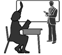
Un buen maestro

Tres de las parábolas de Jesús compararon a gente pecadora, como nosotros, con cosas perdidas y luego halladas con alegría. 2 La enseñanza de las tres parábolas está clara. Hay mucho jubileo en el Cielo cuando pecadores perdidos vuelven al ‘hogar’ con Dios.