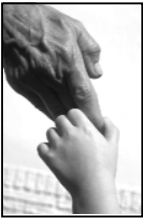
La mano amorosa

La perfección de Jesús demostró la imperfección de otros. Aún Pedro (Su discípulo) se sentía abrumado por su propia pecaminosidad en la presencia de Jesús. 4 Jesús ‘no conocía el pecado’. 5 Considera la evidencia sobre esto en el relato de Su vida que sigue a continuación.