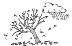
La tentación es como un viento poderoso

Imagina que sopla un viento tan poderoso que es difícil quedarse recto. Esto es un cuadro de la tentación. La tentación es como un viento enérgico. Jesús sabía el poder de la tentación y la miseria que el pecado provoca a una persona. A pesar de que Jesús nunca pecó, tenía compasión por los pecadores.