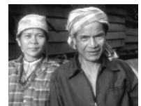
El Cielo es multi-racial

Los creyentes de todas las tierras estarán en el Cielo. El Nuevo Testamento describe el Cielo como un lugar santo donde vive Dios y Sus ángeles. Ninguna cosa impura o pecaminosa pueda entrar allí. 7 Los creyentes son reconciliados con Dios a través de la muerte de Cristo, y su pecado es eliminado. Ahora no existe nada que les impida entrar al Cielo cuando mueran.