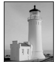
Jesús era una gran luz

Dios nunca creó a la gente para odiar a Jesús, sino que usó el odio dentro del hombre para lograr su propósito. La vida perfecta de Jesús destacaba las imperfecciones en los demás. Por ello odiaban a Jesús y prefirieron matarle para impedir que su Luz expusiera sus propias vidas pecadoras. Jesús era una luz en un mundo oscuro. El hombre intentaba extinguir la luz, prefiriendo la oscuridad de su pecado. Escribe Juan 3:19