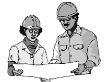
Siguiendo un plan

Los autores del Nuevo Testamento nos dicen que la muerte de Jesús no fue una equivocación terrible, sino parte del plan y propósito de Dios. Dios utilizó la maldad del hombre para otorgar el perdón a aquéllos que renunciaron al pecado. ¡Increíblemente, aquéllos que crucificaron a Jesús también fueron perdonados! ¡Su crimen terrible creó una vía a través de la cual aún su pecado fue perdonado! Luego, en este ejercicio, veremos cómo la muerte de Jesús hace posible el perdón.