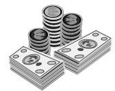
El precio de una fianza

A Jesús le costó mucho reconciliar a los creyentes con Dios. Jesús nos dijo que su muerte era una ‘fianza para muchos’. 6 Una fianza es una suma de dinero que se paga para que se devuelva a una persona. Los secuestradores demandan a menudo una fianza. Jesús dio su vida en lugar de los pecadores como el pago de una fianza para redimir a los creyentes ante Dios. Los creyentes ya no son dueños de sus propias vidas ya que han sido comprados por Jesús y ahora deben vivir por El. Escribe 1 Pedro 1:18-19