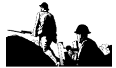
La hostilidad hacia Dios

La enseñanza del Nuevo Testamento es clara- el pecado enfada a Dios Santo, así que el hombre se convierte en enemigo de Dios. Sin embargo Jesús murió en lugar de los creyentes para reconciliarlos con Dios. 5 Ya no son enemigos de Dios porque sus pecados han sido castigados en Cristo y por lo tanto, eliminados.