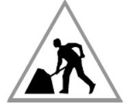
அடையாளங்களுக்கு அர்த்தம் இருந்தது

நம்மைச் சுற்றிலும் எங்கும் அடையாளங்கள் இருக்கின்றன: அவை எல்லாமே ஏதோ ஒரு வகையான அர்த்தத்தைக் கொண்டிருக்கின்றன. உதாரணமாக, ஆட்கள் சாலையில் வேலை செய்கிறார்கள் என்பதற்காக 'வாகன ஓட்டுனர்கள் கவனித்து ஓட்டவும்' என்கிற அறிவிப்பு அடையாள பலகையை சாலையில் காணலாம். இயேசு செய்த அற்புதங்களும் கூட அடையாளங்களாக ஒரு அர்த்தத்தைக் கொண்டிருந்தன. மத்தேயு, மாற்கு, லூக்கா, யோவான் ஆகிய சுவிசேஷங்களில் இயேசு கிறிஸ்து செய்த அநேக அற்புத அடையாளங்கள் எழுதப்பட்டுள்ளன. அதில் பல அற்புதங்கள் மனதுருக்கமானவை. அவர் வியாதியாய் இருந்தவர்களைச் சுகப்படுத்தினார்: சப்பானியை நடக்கச் செய்தார்; பார்வையற்றோரை பார்வையடையச் செய்தார்; அதோடு மட்டுமல்ல இறந்தவரையும் உயிரோடு எழுப்பினார்.