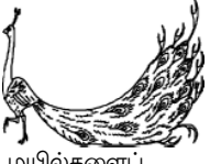
மயில்களைப் போல் கர்வம் கொண்டவர்கள்