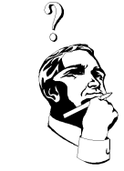
ஒன்று இயேசு உண்மையைச் சொல்கிறார் அல்லது உளறுகிறார்