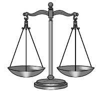
சாட்சியைச் சீர்தூக்கிப் பார்த்தல்

உண்மையைக் கண்டறிவதற்குச் சாட்சிகளைக் கவனமாக ஆராய்ந்து பார்த்தல் நீதிமன்றங்களின் தலையாய கடமை. அவ்விதமாகவே புதிய ஏற்பாட்டு நூலாசிரியர்கள் இயேசுவை குறித்து கூறப்படும் உண்மைகளையும் கவனமாக நாம் கணிக்க வேண்டும் என்று விரும்புகின்றனர். அதுதான் இந்த பாடத்தின் நோக்கமாகும். இயேசுவின் சீடர்களாகிய அப்போஸ்தலர்கள் அவருக்கு சாட்சிகளாக நம்முன் நிற்கின்றார்கள். நீதிமன்றத்தில் சாட்சிகளைக் கேட்டு தீர்ப்பளிக்கவேண்டிய பொறுப்பில் உள்ளவர் போன்று நீ இருக்கிறாய். இயேசுவின் சீடர்கள் (அப்போஸ்தலர்) சாட்சிகளாக இருக்கின்றனர். அப்போஸ்தலர் 2:32ஐ வாசிக்கவும்.