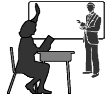
ஒரு நல்ல ஆசிரியர்

இயேசு கூறிய உவமைகளில் மூன்று, நம்மைப்போன்ற பாவம் நிறைந்த மனிதர்களுடன், மீண்டும் சந்தோஷத்துடன் கிடைக்கப்பெற்ற காணாமற்போன பொருள்களுக்கு ஒப்பிடப்படுகின்றன. இம்மூன்று உவமைகளிலிருந்தும் கற்றுக்கொள்ளும் பாடம் தெளிவானது. அது என்னவெனில் தொலைந்துபோன பாவிக்க கடவுளின் வீட்டை வந்தடையும்போது மோட்சத்தில் சந்தோஷமுண்டாயிருக்கும் என்பதே.