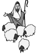
ஒரு கிழக்கத்திய மேய்ப்பன்

இயேசுவின் காலத்தில் மேய்ப்பர்கள் தங்கள் ஆடுகளை ஓநாய்களிடமிருந்து காக்கத் தங்கள் உயிரையும் கொடுக்க தயங்கமாட்டார்கள். தன் ஆடுகளுக்காக (அதாவது - விசுவாசிகளுக்காக) மரிப்பேன் என்று இயேசு சொன்னார். தன்னுடைய ஆடுகளுக்குப் பதிலாக தன்னுடைய ஜீவனையே கொடுக்கப்போகும் நாளை அவர் முன்னறிந்திருந்தார். யோவான் 10:11ஐ பார்க்கவும்.