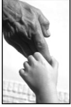
அன்பு நிறைந்த கரம்

இயேசுவின் பூரணத்துவம், மற்றவர்களின் பூரணமற்ற நிலைமையைக் காட்டுகிறது. பேதுருவும் ( அவரது சீடன் ) இயேசுவின் பிரசன்னத்தில் தனது சொந்த பாவத்திலிருந்து வெற்றிகொள்ளும் நிலைமையை உணர்ந்தான். 4 இயேசு பாவமறியாதவராயிருந்தார். 5 அவரது வாழ்க்கையின் பதிவுகளிலிருந்து இதற்கான ஆதாரங்களை நாம் ஆழ்ந்து சிந்திப்போம்.