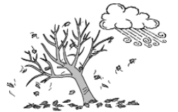
ஒரு பலத்தக்காற்றைப் போன்றது