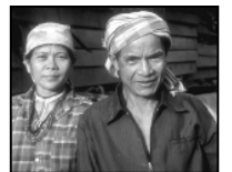
பரலோகம் பலவகைப்பட்ட இனங்களால் அமைந்தது.