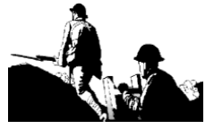
கடவுளுக்கு எதிரான பகைமை