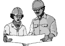
ஒரு திட்டத்தின்படி செயல்படுத்தல்