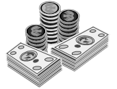
ஒரு மீட்பின் விலை!