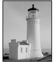
இயேசு ஒரு பெரிய வெளிச்சம்

வரலாற்றுக் குறிப்பு : சிலுவையிலிறைதல் ஒருமெதுவான. வேதனை நிறைந்த மரணம். பாதிக்கப்பட்டவனின் கரங்கள் மற்றும் கால்கள் சிலுவையோடு ஆணிகளால் அடிக்கப்பட்டிருக்கும். இயேசு சிலுவையிலிறையப்படும் முன்பு மிகவும் மோசமாக சாட்டையால் அடிக்கப்பட்டார்.